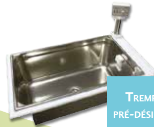
TREMPAGE & PRÉ-DÉSINFECTEUR

RESPECTER LES OBLIGATIONS ET LES RECOMMANDATIONS DE DÉCONTAMINATION ET DE STÉRILISATION.