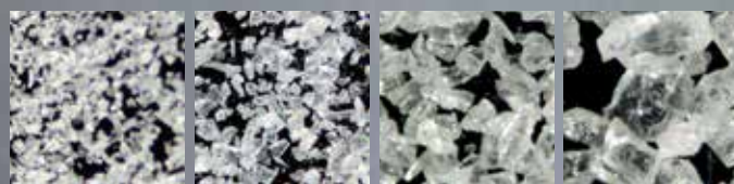
Cobra 25 µm